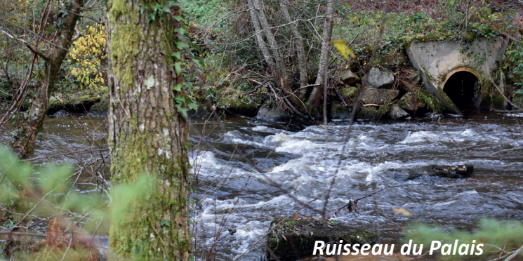
Ruisseau du Palais

06 Arrivé dans le coeur du village de Payaux, prendre la route à gauche puis le chemin à droite. Longez les étangs sur votre droite. Après 150 mètres, avant la route, prendre le chemin à droite.