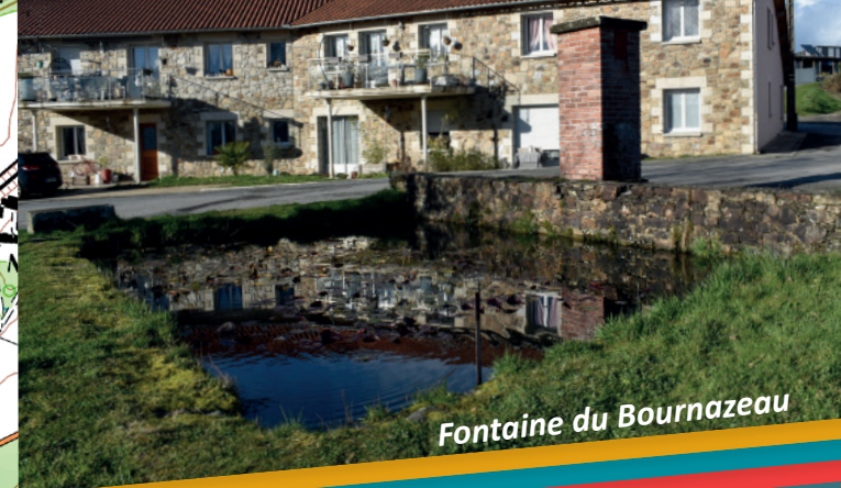
Fontaine du Bournazeau