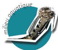
ÉMERGENCE HORS DE L'EAU