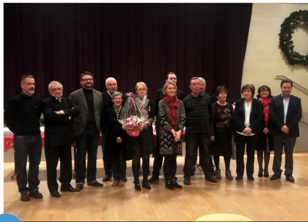
2 Les médaillés et retraités communaux