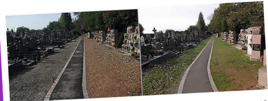
Exemple d'engazonnement à Dunkerque (59)

ATTENTION , le règlement intérieur du columbarium et du jardin du souvenir interdit le dépôt de fleurs. Quelques-unes sont tolérées le jour des obsèques mais elles sont retirées par les agents municipaux à leur flétrissement.