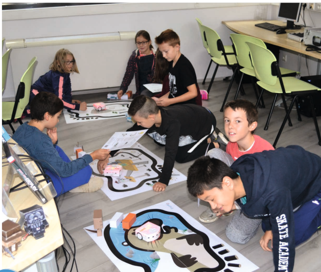
4 Semaine du code - atelier multimédia de la médiathèque