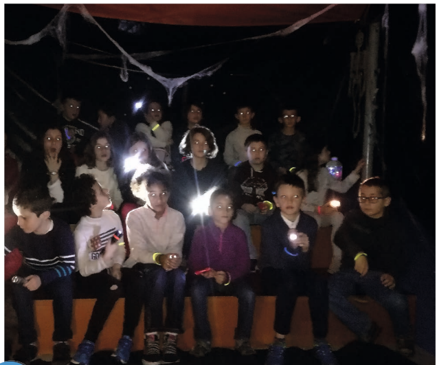
5 Nuit de la lecture à la bibliothèque