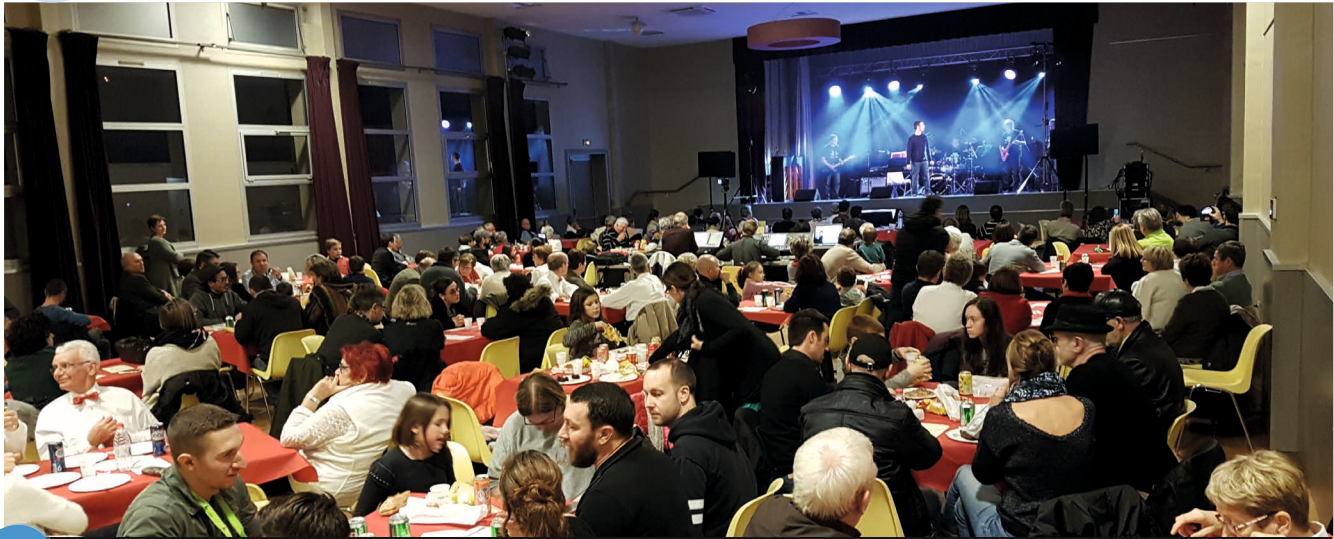
1 Scène ouverte 2018