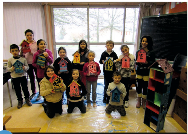
3 Création de nichoirs par le centre de loisirs