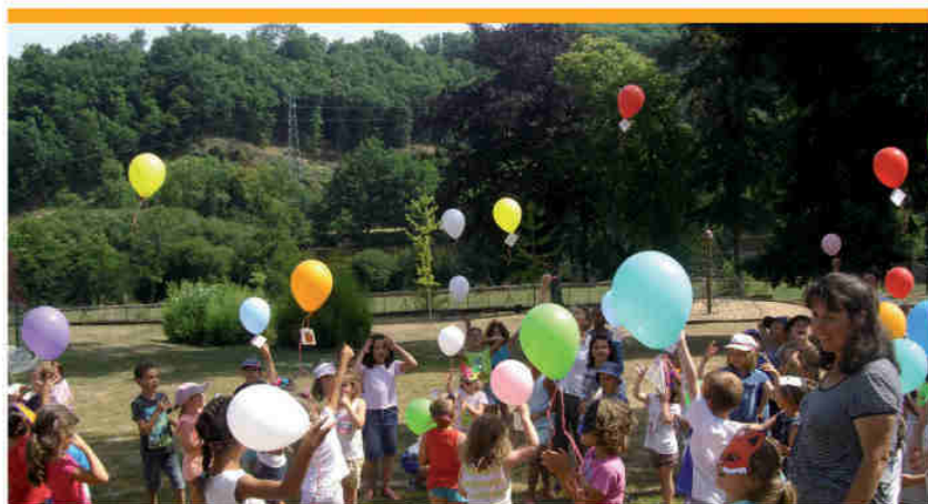
Lâcher de ballons l'été