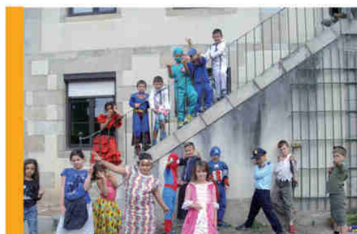
Déguisement en été