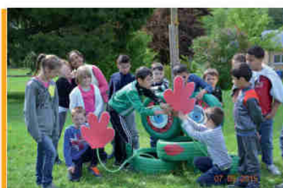
Ateliers "les mercredis"