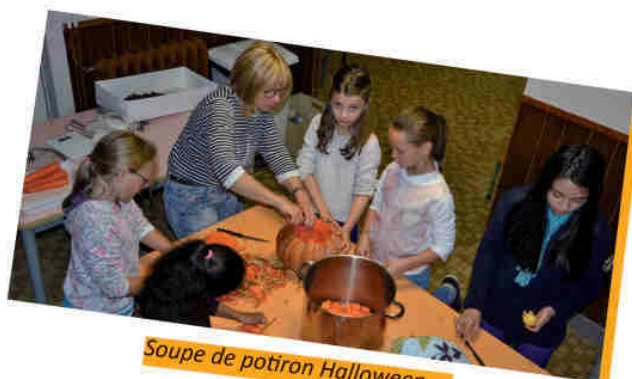
Soupe de potiron Halloween