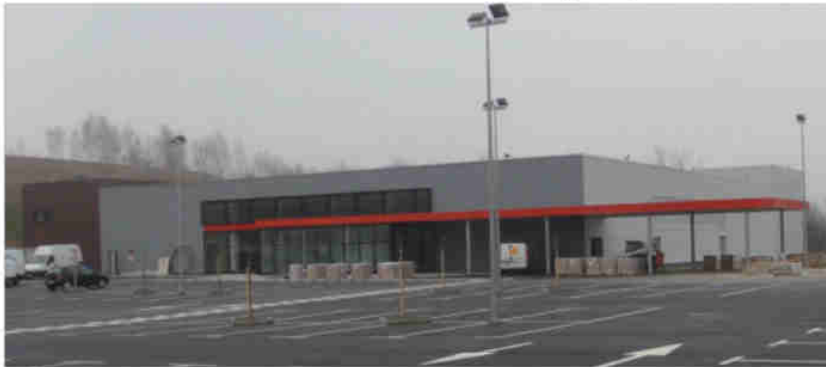
Le futur Super U en travaux