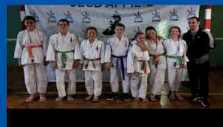
L'entente benjamin Le Palais/Rilhac Rancon au tournoi d'Isle

Venez au dojo le jeudi (à 20h) pour essayer et pourquoi pas continuer... Pour tous renseignements (horaires, tarifs, résultats) : http://judo-lepalais.clubeo.com/ ou 06 82 08 55 96.