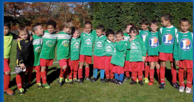
La SAP soufflera ses 90 bougies