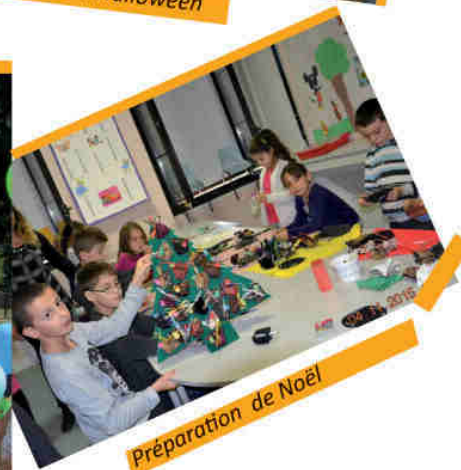
Préparation de Noël