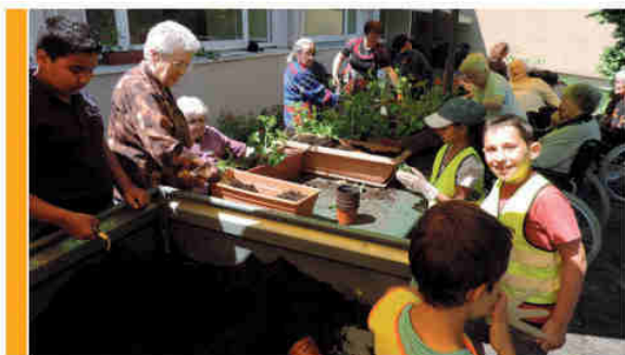
Jardinage et cuisine avec les aînés de l'EPHAD