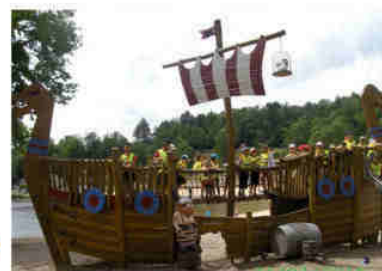
Sortie à Vassivière