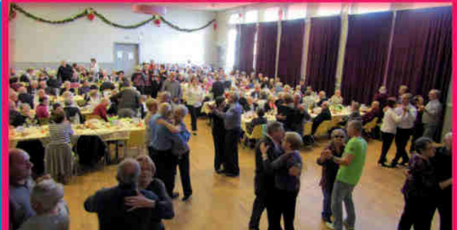
Le repas des aînés