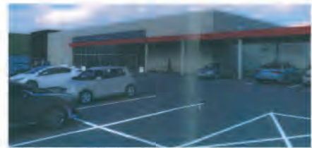
Projet d'implantation du Super U

En matière d'économie et de création d'emplois, le permis de construire déposé par la société Demussi pour la construction d'un bâtiment de stockage et de vente en gros de matériaux de construction de près de 7000 m 2 au total, situé face au contrôle technique, le long de la nouvelle rue Léonard de Vinci, a été accordé fin septembre. Les tra-