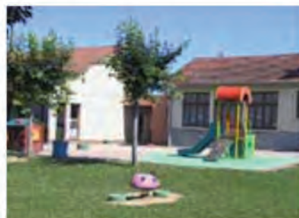
Ecole Aristide Briand

Maternelle : 48 (2 classes PS et MS/GS) Primaire : 63 (3 classes CP/CE1 - CE2/CE2 et CM1/CM2)