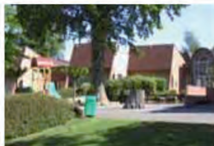
Ecole Jean Giraudoux