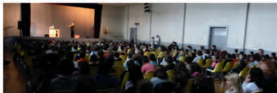
Concert avec les Jeunesses Musicales de France