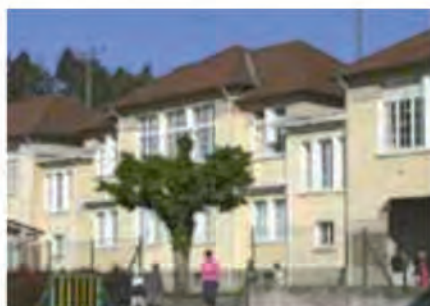
Ecole Jules Ferry