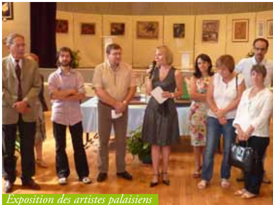
Exposition des artistes palaisiens