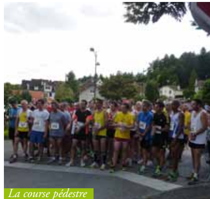
La course pédestre