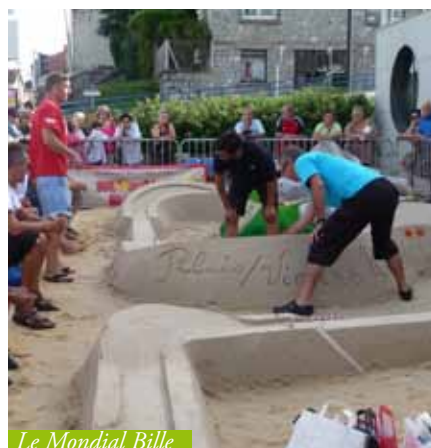
Le Mondial Bille