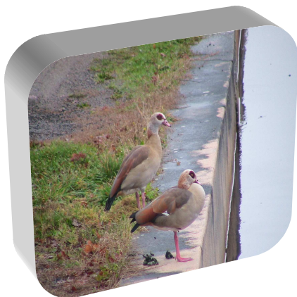
Oie d'Égypte : sieste. 2 janvier 2011