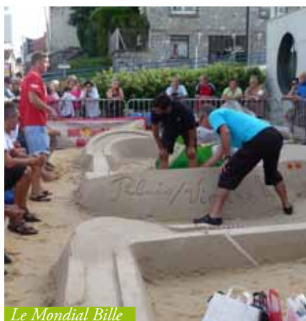
Le Mondial Bille